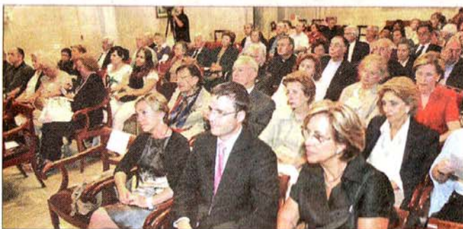
Numerozo público asistió al acto.